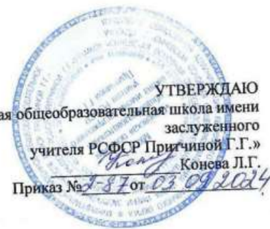
График оценочных процедур в МКОУ «Сычёвская основная общеобразовательная школа имени заслуженного учителя РСФСР Притчиной Г.Г.» 2,3,4 класс на I полугодие 2024 – 2025 учебный год.